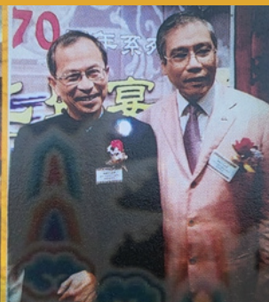
立法會議員曾鈺成（左）參與【滿漢文化·天下一家】。