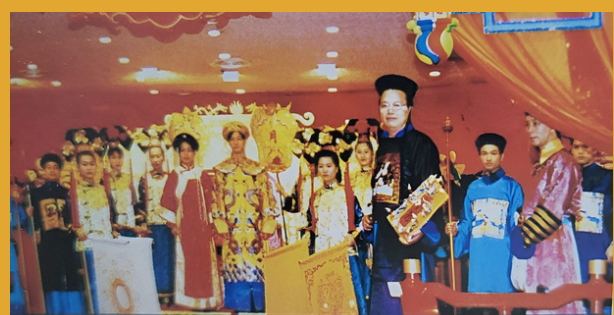
1989/1995及1997年新光集團舉辦約二百人滿漢華筵。多位美食家好評如潮！