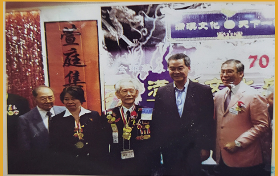
行政長官梁振英與主席胡珠及老戰士黃光漢和魏慧合照