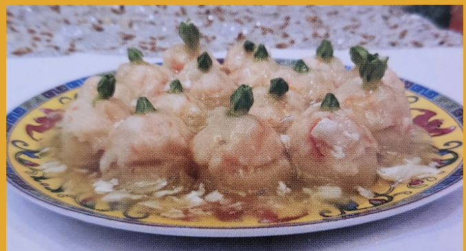
花香馬蹄：以蝦膠打造配襯馬蹄作底，混入蛋白獻汁，花朵形狀耀目萬分，這是一道令人心動的特色菜。