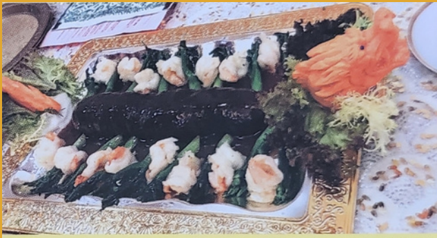
龍船海參：龍船以貴氣的蘿蔔雕刻龍頭為重頭裝飾，船身則以厚肉的海參燴選參，兩旁以蝦肉和菜心雙重襯托，尊貴龍船揚帆出航，在席上閃亮登場。