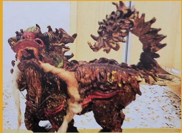
1965年胡珠手制麵粉公仔—麒麟兔玉書