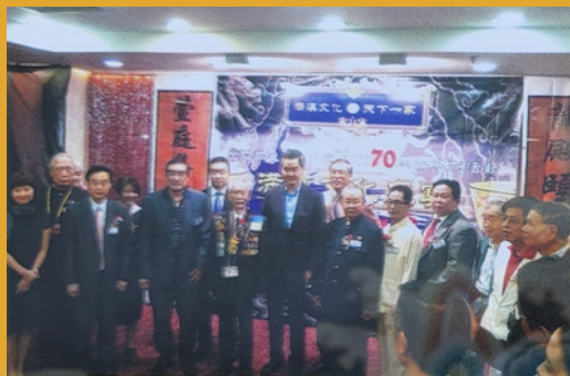
特首梁振英（左八）與抗戰老兵魏斐（左七）、婆羅洲大公國國王梁田（左十）與非遺卜先云等一眾賓客赴會滿漢全席，一同合照。