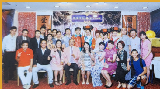
「和平文化教育發展基金會」發展理念在於傳承及弘揚中華文化，剛於2015年8月中旬舉辦了滿漢全席宴。